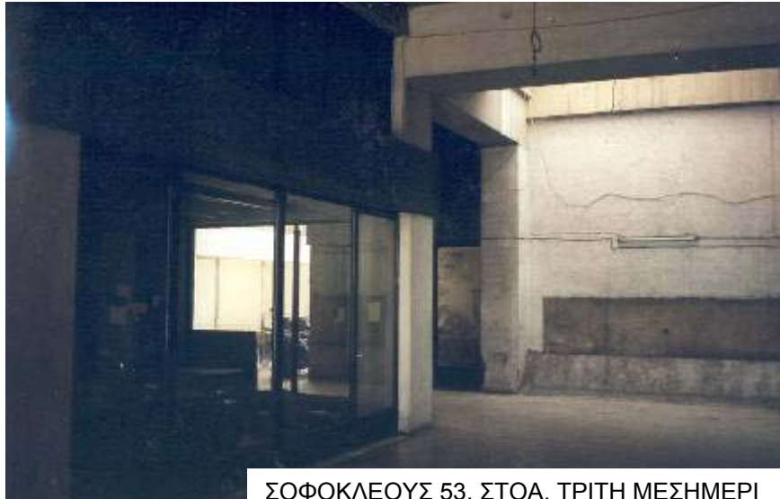
ΣΟΦΟΚΛΕΟΥΣ 53, ΣΤΟΑ, ΤΡΙΤΗ ΜΕΣΗΜΕΡΙ

παραμένουν μονίμως κλειστές. Απ' ότι φαίνεται σήμερα οι πόρτες του μικρού αυτού χώρου πρασίνου ανοίγο-κλείνουν κατά βούληση των υπαλλήλων του δήμου που εργάζονται στο κτίριο.