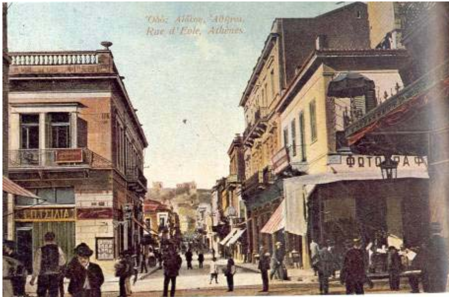
Διασταύρωση Αιόλου – Σοφοκλέους.