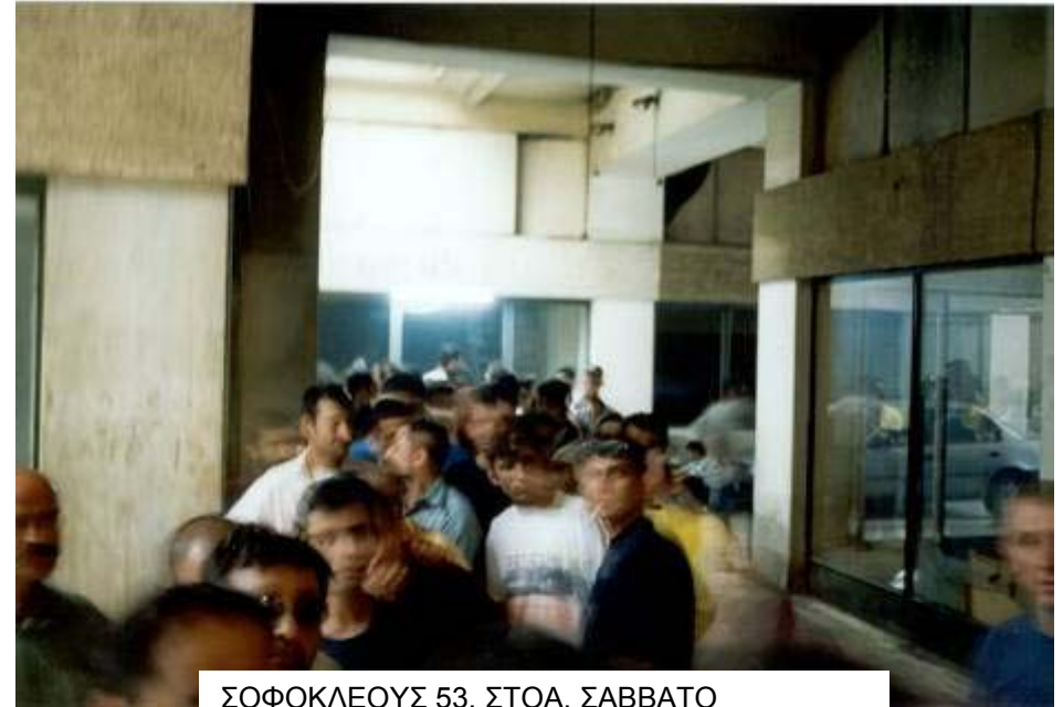
ΣΟΦΟΚΛΕΟΥΣ 53, ΣΤΟΑ, ΣΑΒΒΑΤΟ ΜΕΣΗΜΕΡΙ