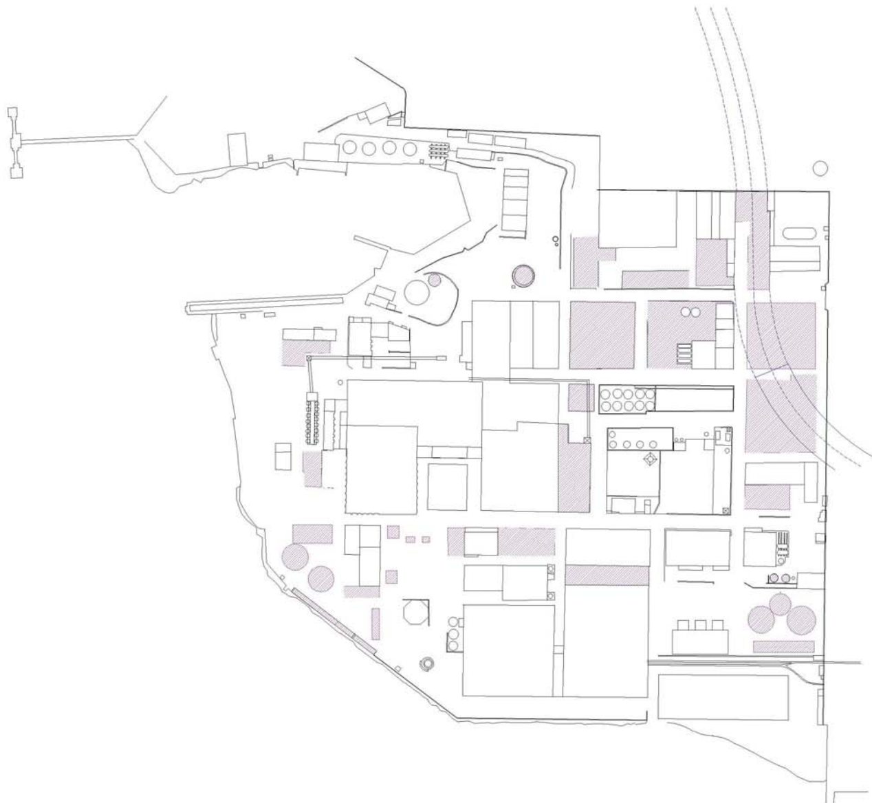
σχ. 2 Χάρτης μη διατηρητέων κτιρίων και εξοπλισμού

ΚΤΙΡΙΑ ΚΑΙ ΕΞΟΠΛΙΣΜΟΣ ΠΟΥ ΔΕΝ ΧΑΡΑΚΤΗΡΙΖΟΝΤΑΙ ΔΙΑΤΗΡΗΤΕΑ