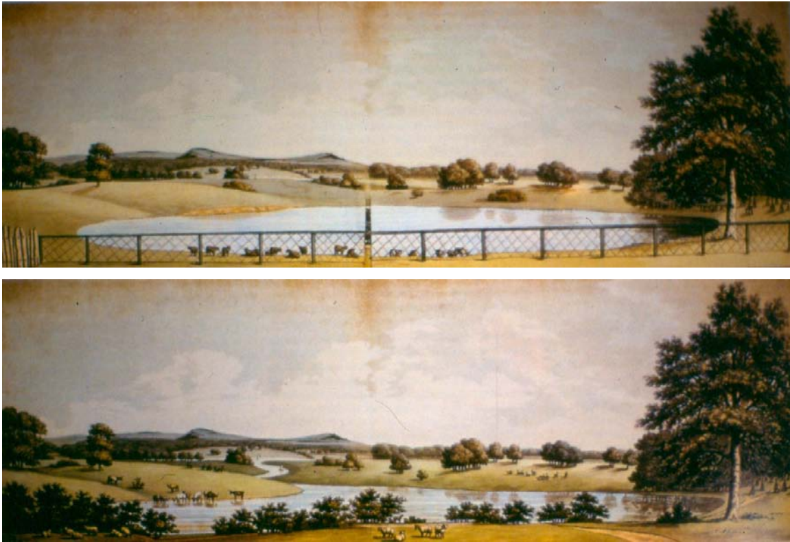
Εικ. 2: Humphry Repton: Tatton Park, Cheshire, 1792 . Προς διαμόρφωση χώρος και πρόταση.

Με αποκαλυπτικό τρόπο η κριτική φιλοσοφία, σημαντικό μνημείο της δυτικής σκέψης των νεότερων χρόνων, περιγράφει άλλοτε έμμεσα και άλλοτε με περιορισμένα σε έκταση, αλλά σαφέστατα σχόλια, μια άλλη μνημειώδη κίνηση του νεότερου δυτικού πολιτισμού. Την προσπάθεια του να αντιληφθεί, να ερμηνεύσει και να διαμορφώσει την τοπιακή έκταση, να «καταλάβει» τον τόπο.